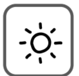
invierno en Florida