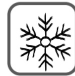
invierno en Wisconsin

Pero no nieva cada invierno en todos los lugares. ¡En el estado estadounidense de Florida, un día de invierno puede ser tan caluroso como un día de verano en Wisconsin! Casi nunca nieva en la mayor parte del estado. Las estaciones en Florida no se parecen a esos símbolos de las cuatro estaciones. Pero Florida sí tiene estaciones. Los cambios que demuestran que el otoño ha llegado a Florida son simplemente DIFERENTES a los de Wisconsin.