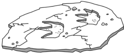
Figuras en el suelo

¿Cómo crees que se hicieron esas figuras?