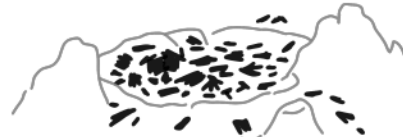
Ceniza y madera negra y desmoronada

¿Cómo supones que llegaron esas figuras a la cueva?